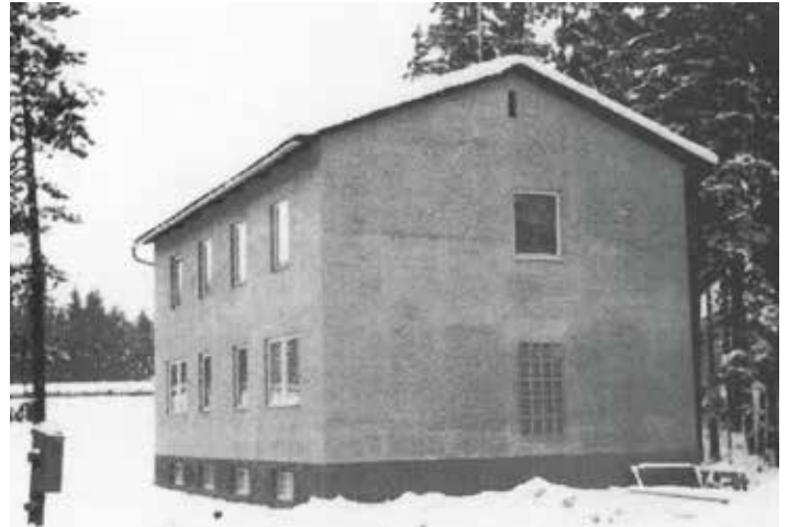
Das neu erbaute Sporthaus im Winter 1962

Ab 1928 nahmen Vereinsmitglieder an verschiedenen Wettkämpfen teil, wie z.B. Handball, Faustball, Leichtathletik oder auch Schifahren. Ein besonderer Höhepunkt war anlässlich 10 Jahre Volksabstimmung 1930 eine Turnveranstaltung, zu der Riegen aus ganz Österreich nach Ferlach kamen. Zu dieser Zeit