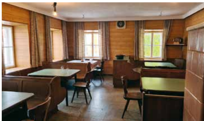
Ein Blick in den 1. Stock.