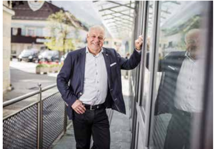
Bürgermeister BR RgR Ingo Appé