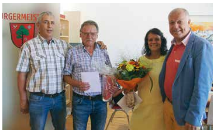
Die Stadtgemeinde Ferlach wünscht den beiden Ruhestandlern viel Gesundheit, Glück und Freude für den neuen Lebensabschnitt!

In den Ferien ging es dann mit den Jugendlichen vom Wasserpark in Italien, über das Mega-Diving im Lesachtal bis hin ins Fahrsicherheitszentrum nach Mail.