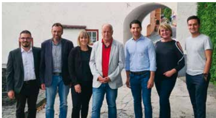
Die Mitglieder des Stadtrates bei der Besichtigung.

Zukunftsprojekte wie Start Up Möglichkeiten, Co-Working Bereiche, Werkstätten, Sprachlabor sowie leistbare Unterbringungsmöglichkeiten könnten hier geschaffen werden. Auch das ehemalige Gasthaus kann wieder aktiviert werden. Das Haus soll vor allem ein Begegnungsort für alle Volksgruppen werden, das Gemeinsame soll hier vor das Trennende gestellt werden. In einem nächsten Schritt wird mit Unterstützung des Landes gemeinsam mit BürgerInnen und Architektenteams die zukunftsorientierte Nutzungsmöglichkeiten erarbeitet.