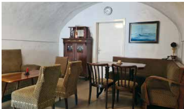
Das ehemalige Gastzimmer.